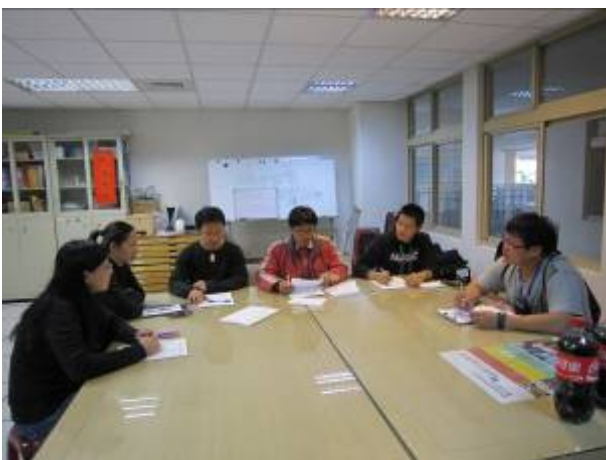
健康與體育領域教師討論情形