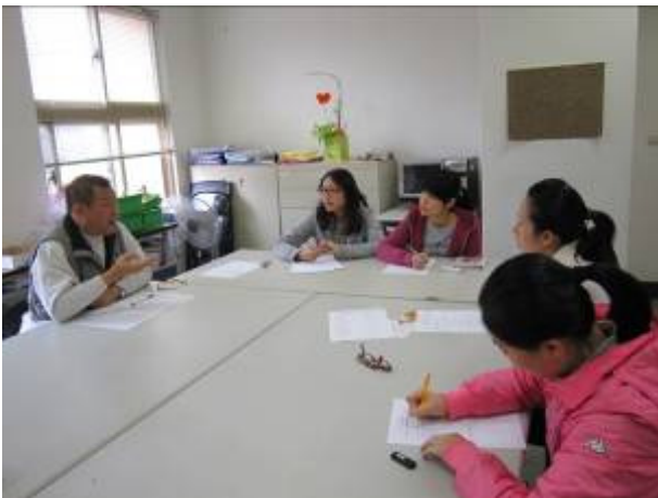
中年級自然、社會、田園科教師討論情形