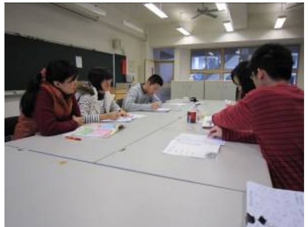
高年級自然、社會、田園科教師討論情形