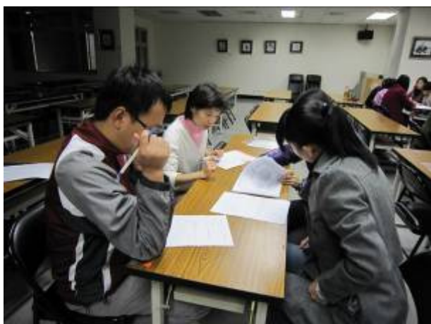
四年級教師討論情形