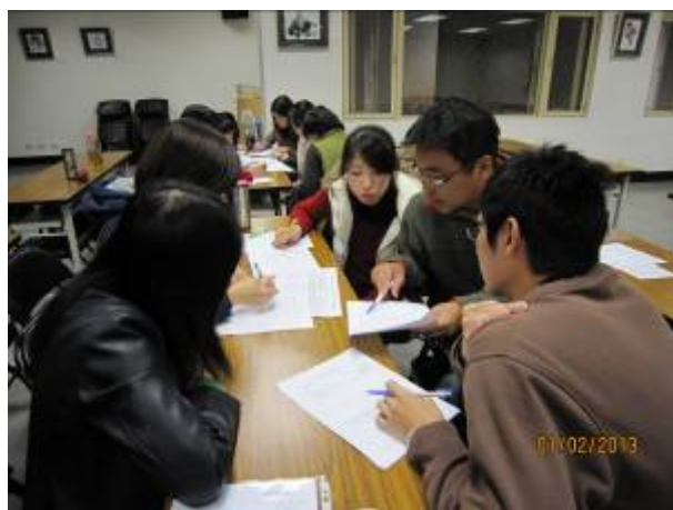
五年級教師討論情形