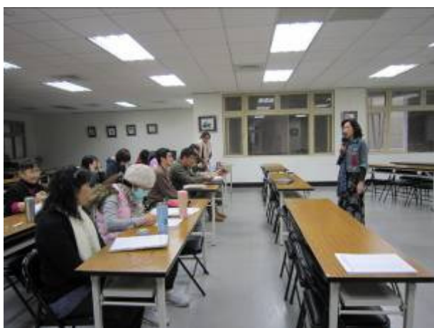
教務主任主持課程評鑑會議