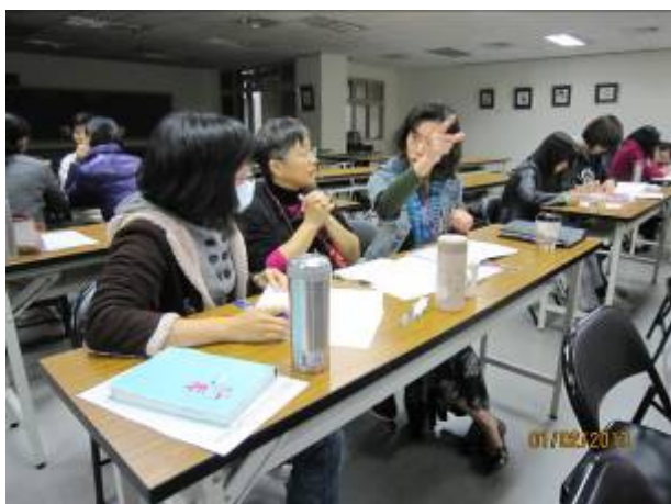
二年級教師討論情形