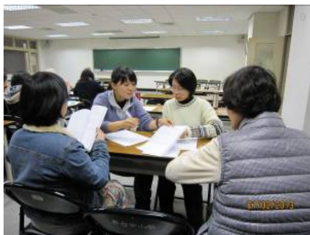
三年級教師討論情形