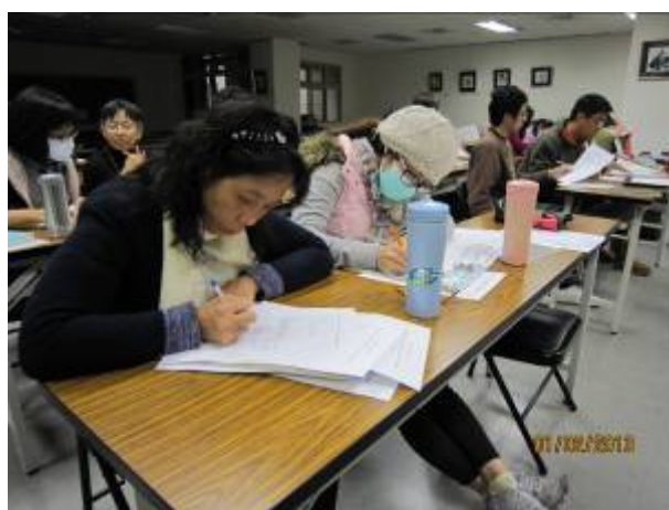
一年級教師討論情形