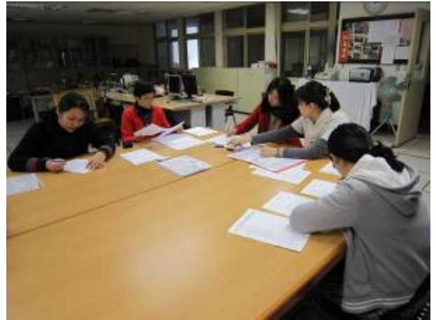
低年級國學、生活、田園科討論情形