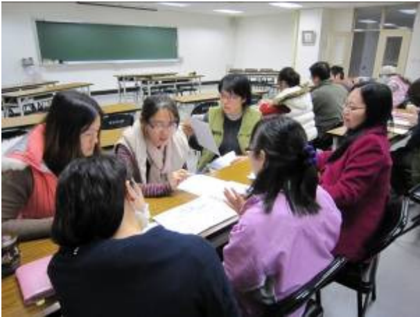
六年級教師討論情形